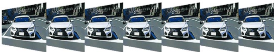
従来の当社製デジタルルームミラー（録画機能付モデル）：1 秒間に 27~29 コマで表示