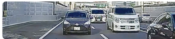
<拡大率 2.0x (イメージ)>