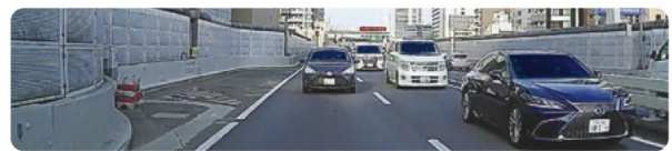
<デジタルルームミラー（イメージ）>