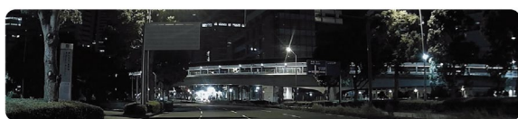
<従来の当社製デジタルルームミラー（録画機能付モデル）（イメージ）>

当社がドライブレコーダーの開発において長年にわたり培ってきた独自の映像技術と車載技術を組み込み、チューニングを行った「Hi-CLEAR TUNE」（ハイクリアチューン）に、さらに最適なチューニングを実施。これにより、従来の当社製デジタルルームミラーと比べ、より自然でクリアな画質表示を実現します。