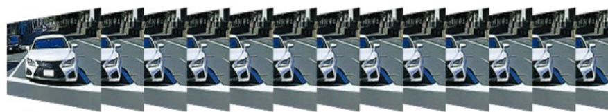
「LZ-X20EM」：1 秒間に 59 コマで表示