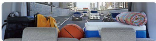
<従来のルームミラー（イメージ）>