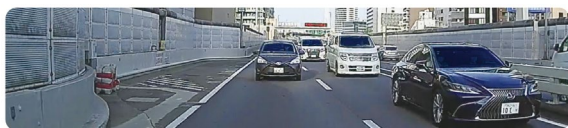
<拡大率 1.0x (イメージ)>

※1：表示画角調整機能は標準の映像(1.0x)を拡大処理するため、倍率を上げると解像度は下がります。