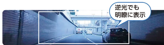
<HDR 搭載 (イメージ)>